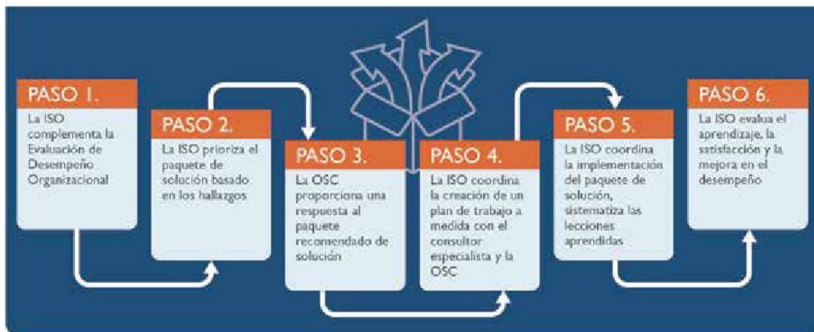
FIGURA 7. PASOS PARA ELEGIR, ADAPTAR E IMPLEMENTAR PAQUETES DE SOLUCIONES

Como se indica en la Figura 5, las ISOs colaboran con consultores y OSC Organizaciones Subvencionadas para desarrollar un plan de trabajo para la Implementación del paquete de soluciones. La Figura 6 proporciona un ejemplo del plan de trabajo de Fortalecimiento Institucional que las ISOs crean y acuerdan con la OSC subvencionada antes de la Implementación, que indica lo siguiente: periodo de Implementación, objetivos generales y específicos, modalidades y notas sobre la adaptación de contenido. (Vea la sección de Recursos).