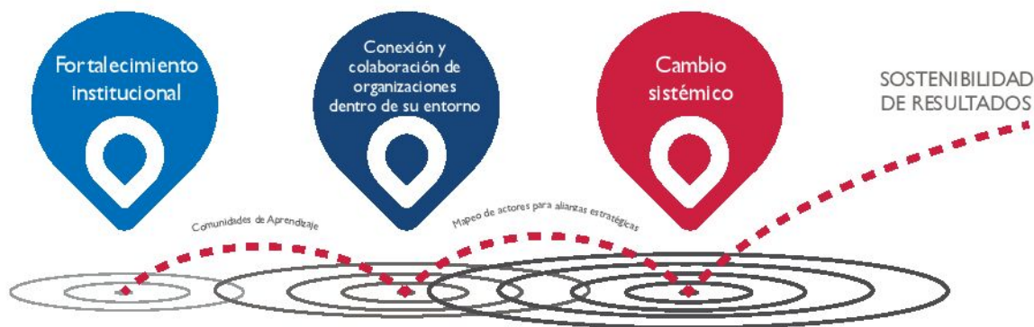
FIGURA I. ESTRATEGIA DE CSA PARA LA SOSTENIBILIDAD DE LOS RESULTADOS

Con un énfasis en la mejora del desempeño organizacional, la evaluación rigurosa, la co-creación de soluciones, el impacto sistémico y la sostenibilidad, el enfoque integral del Programa está alineado con la Ruta hacia la autosuficiencia (J2SR) de USAID y se enfoca en las capacidades locales medibles y aumentadas. Por lo tanto, el Programa para la Sociedad Civil de USAID ofrece un modelo potencial para otros programas de desarrollo de capacidades financiados por USAID, así como otras iniciativas de desarrollo de capacidades, para aumentar el impacto y la sostenibilidad del desarrollo.