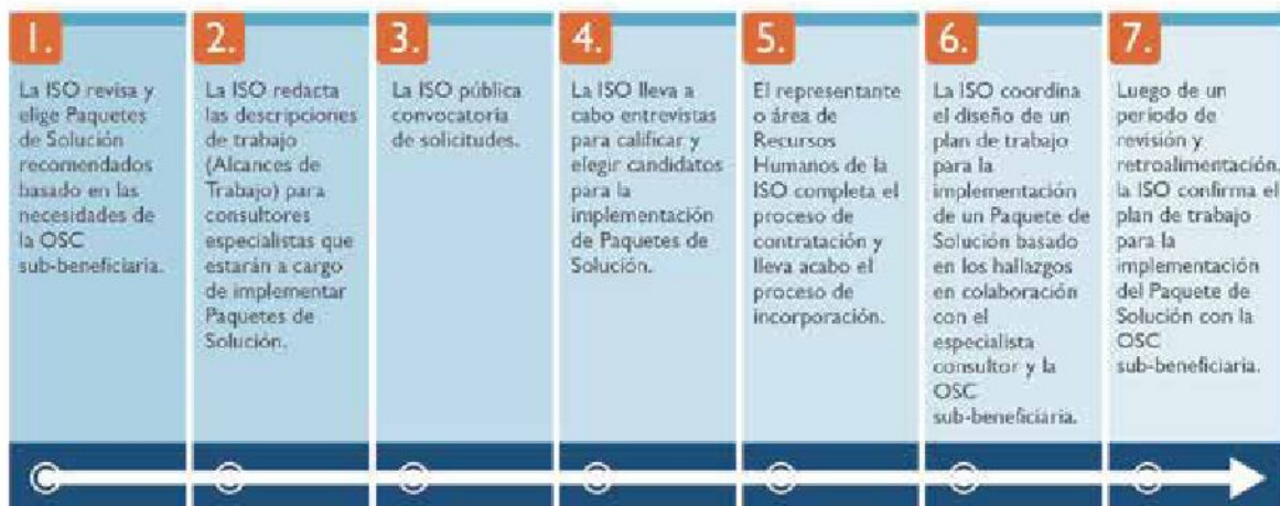
FIGURA 6. RECURSOS DE CONSULTORES PASO A PASO

La Implementación de paquetes de soluciones requiere la contratación y la capacitación de consultores especialistas que tengan experiencia en las áreas de desempeño organizacional que sean priorizadas por la OSC subvencionada. El proceso de contratación, capacitación y asignación de consultores está compuesto por una serie de pasos que deben ser administrados por la persona o por el área responsable de Recursos Humanos dentro de la ISO. La Figura 4 demuestra todos los pasos requeridos para contratar, capacitar y asignar especialistas consultores, que finaliza con el diseño de planes de trabajo detallados para la Implementación de paquetes de soluciones a la medida. En conjunto, el proceso representado en la Figura 4 toma un mes para completarse.