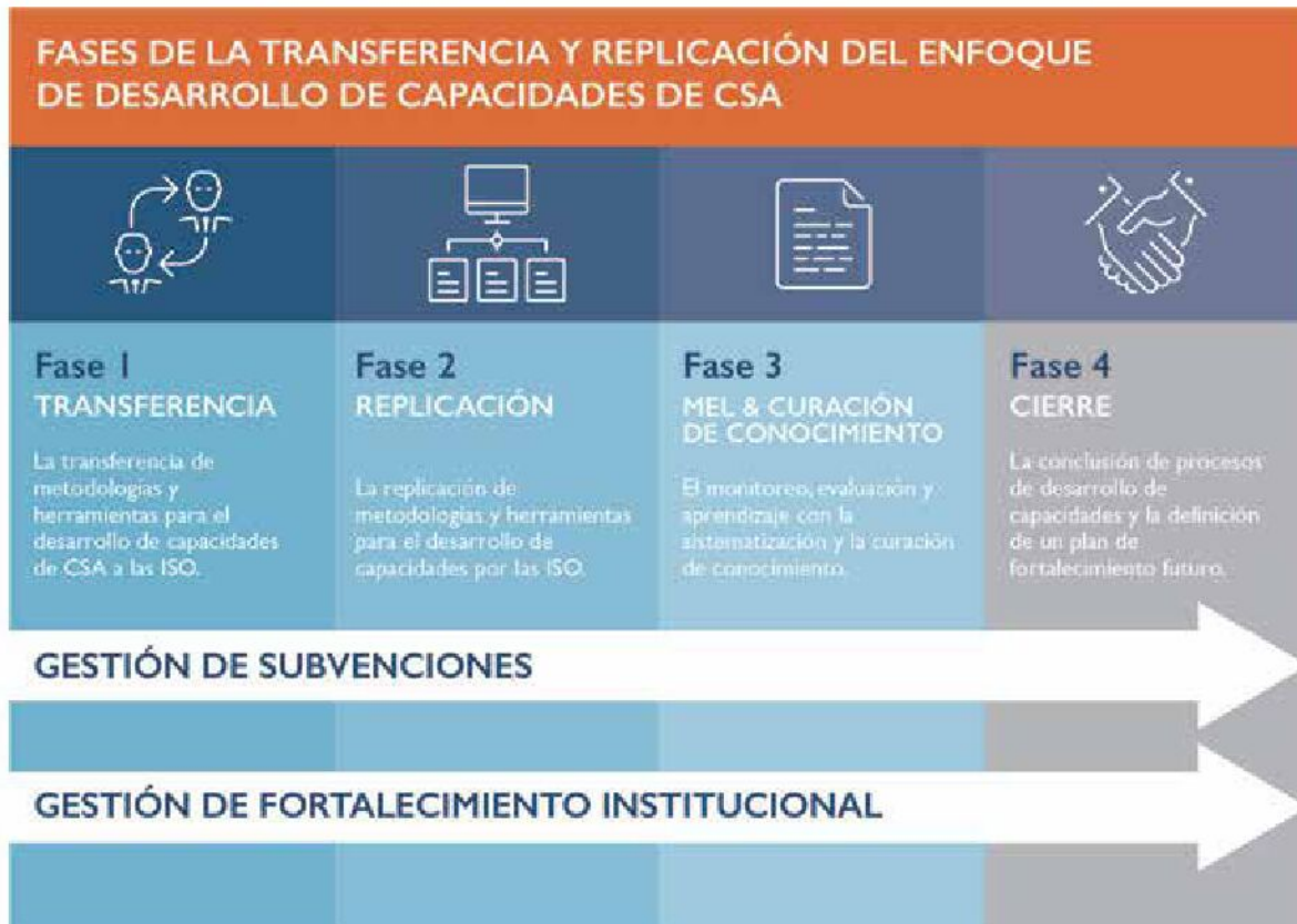
FIGURA 3: FASES PARA LA AMPLIACIÓN DEL ENFOQUE DEL PROGRAMA PARA LA SOCIEDAD CIVIL

Cada una de estas fases involucra dos modalidades clave de aprendizaje, Capacitación y Aprendizaje Práctico. La fase de transferencia enfatiza la capacitación, mientras que la fase de replicación pone mayor énfasis en aprendizaje práctico y aplicado.