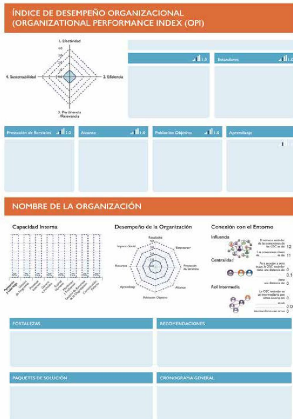
FIGURA 4. HERRAMIENTA DE EVALUACIÓN INTEGRADA DEL PROGRAMA PARA LA SOCIEDAD CIVIL DE USAID