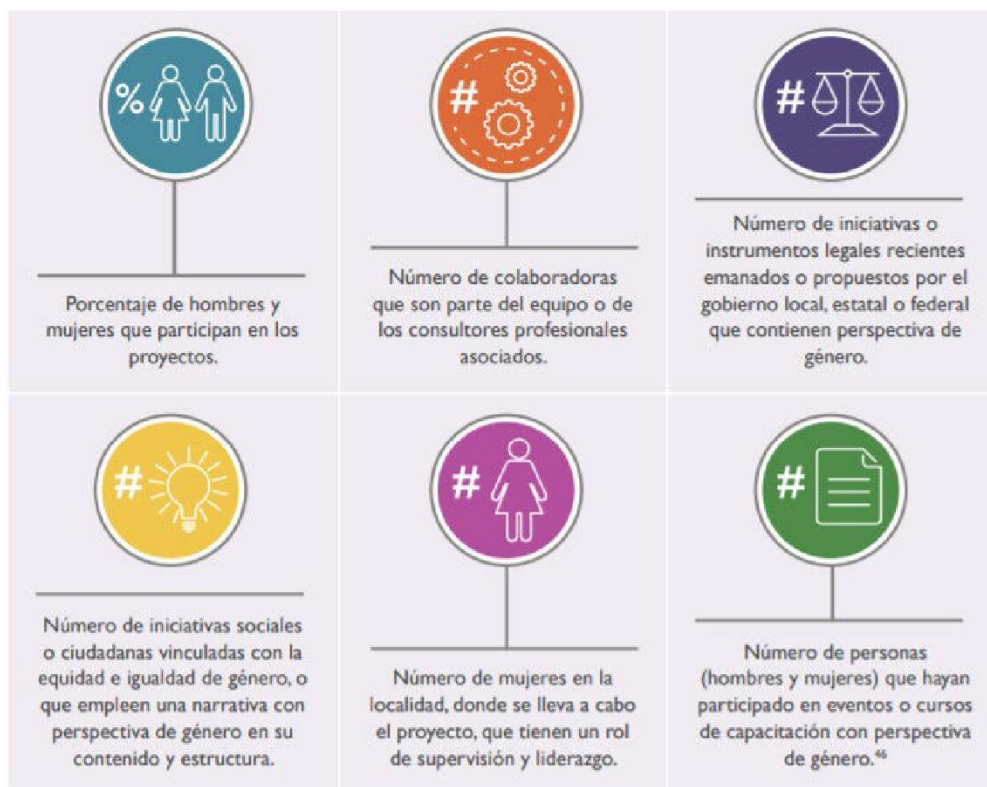
CUADRO 11. EJEMPLOS DE INDICADORES DE PERSPECTIVA DE GÉNERO

Ejemplos de Indicadores de Perspectiva de Género: Paquete de Diseño de Proyectos