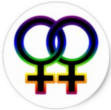
Doble símbolo femenino usado por las mujeres lesbianas