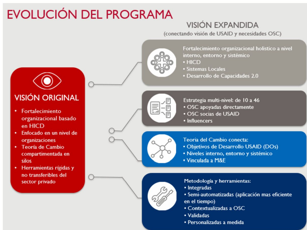
Figura 2. Evolución del Programa para la Sociedad Civil de USAID

Si basó el diseño original del Programa en el modelo HICD. Sin embargo, a medida que CSA se familiarizó con Capacity 2.0 en USAID y realizó sesiones de pausa y reflexión con organizaciones aliadas, el Programa determinó la necesidad de ampliar su enfoque de desarrollo de capacidades. De acuerdo con un enfoque de Colaborar, Aprender y Adaptar (Collaborating, Learning and Adapting CLA) 9 , el equipo del Programa propuso componentes adicionales a la teoría del cambio que complementarían el diseño original de HICD y a la vez integrarían las mejores prácticas más actuales en el campo. En línea con los enfoques de Sistemas Locales y Desarrollo de Capacidades 2.0, el Programa comenzó a conceptualizar el fortalecimiento organizacional en tres dimensiones: fortalecimiento de capacidades internas; fortalecimiento de las relaciones y redes en las que participan las organizaciones; y el fortalecimiento de las posiciones de las organizaciones dentro de sus sistemas locales.