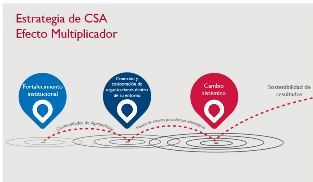
Figura 1. Estrategia del Programa para la Sociedad Civil

El Programa para la Sociedad Civil de USAID implementó un enfoque sistémico para el desarrollo de capacidades en tres componentes principales: